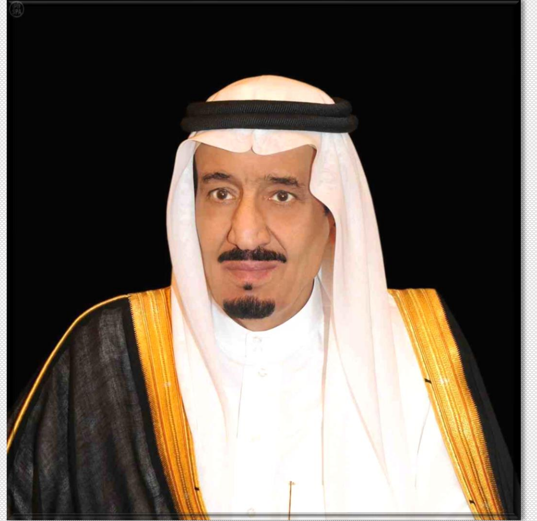
الملك سلمان بن عبدالعزيز آل سعود خادم الحرمين الشريفين حفظه الله