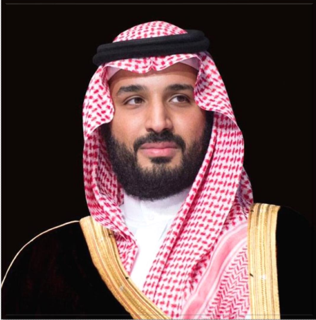
صاحب السمو الملكي الأمير محمد بن سلمان بن عبدالعزيز آل سعود ولي العهد نائب رئيس مجلس الوزراء وزير الدفاع حفظه الله